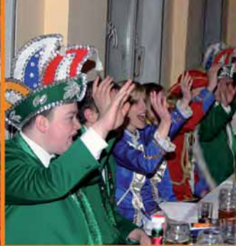
Wir hegen viele Vereinsfreundschaften.