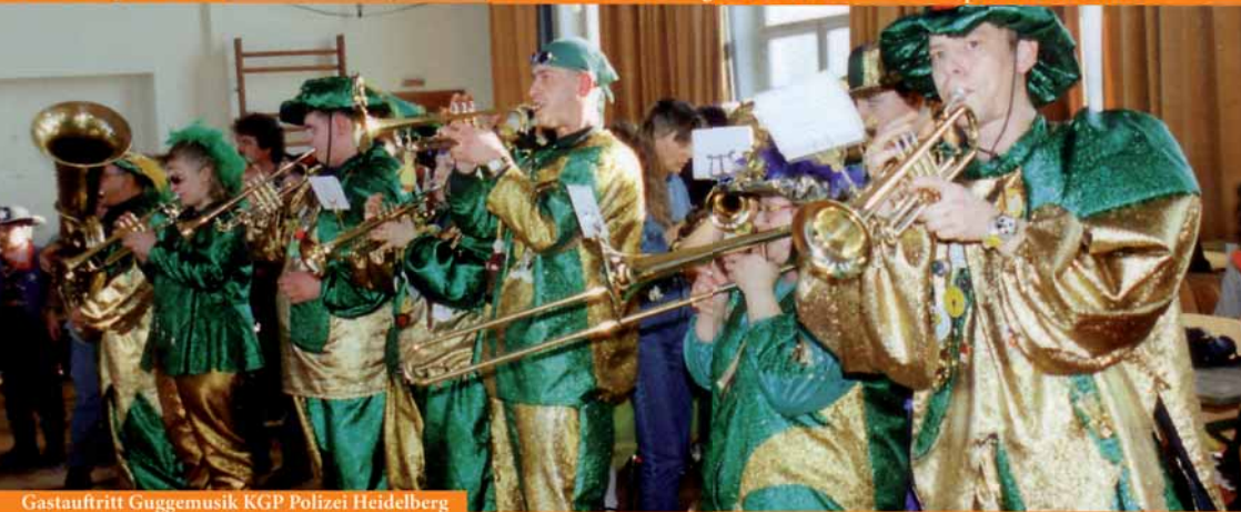
Gastauftritt Guggemusik KGP Polizei Heidelberg