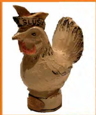
Henne - Auszeichnung des Elferrates