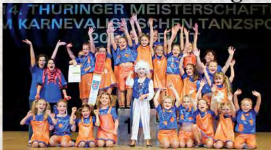
Thüringenmeister „Ein Tag voll Musik“