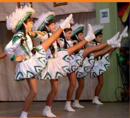
Die Purzelgarde 2011