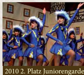
2010 2. Platz Juniorengarde