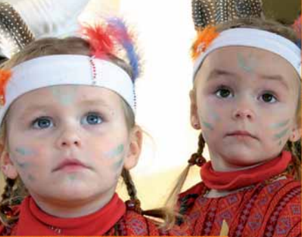
stauende Augen zum Kinderfasching