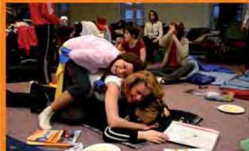
Spaß vor dem Auftritt