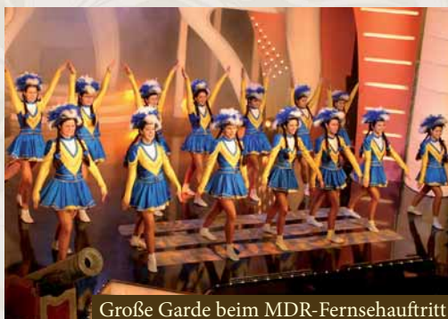
Große Garde beim MDR-Fernsehaustritt