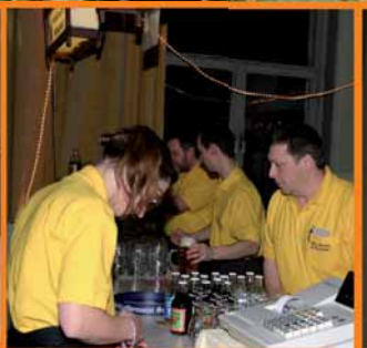
Gastro-Team zum Faschingssamstag